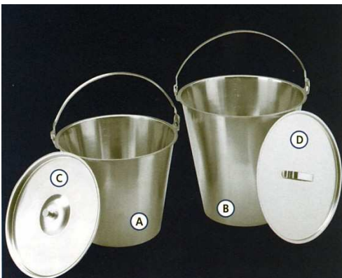
A : Seau inox 10 litres - Réf. MP-067777