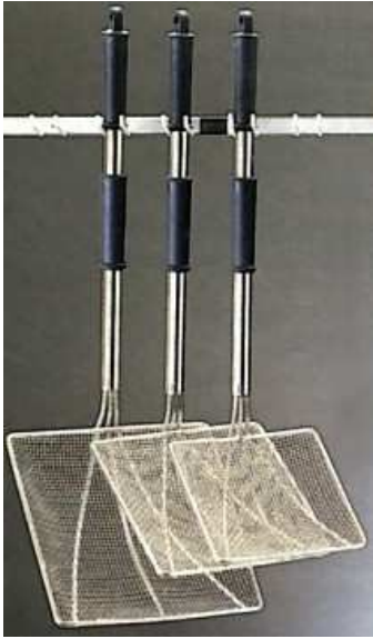
Araignée carrée renforcée Ø 260