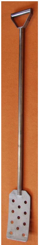
Spatule forte inox