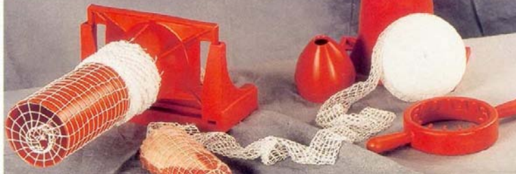
Position horizontale pour le bridage du rôti