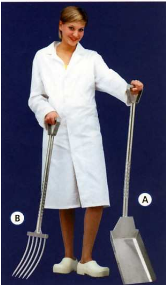
A : Pelle inox - long. 1190 mm Réf. MP-066491