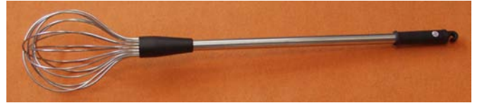
Fouet à purée - long. 1m