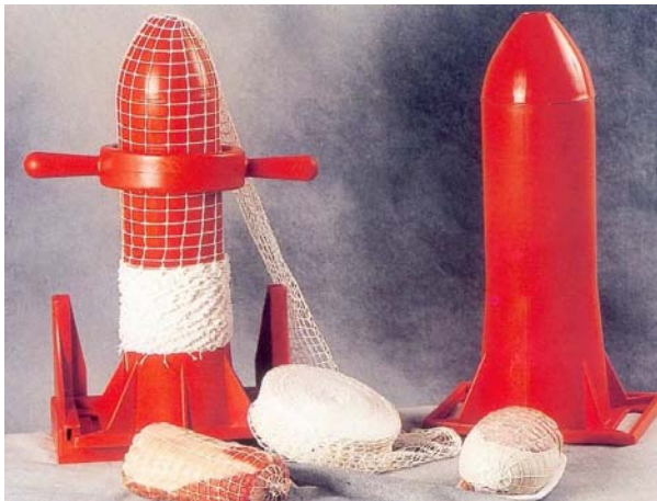
Position verticale pour l'embossage du filet élastique