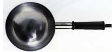
Vide marmite inox Ø 200 mm