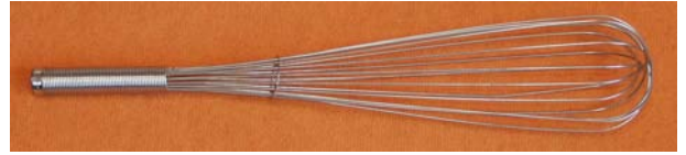
Fouet inox - long. 450