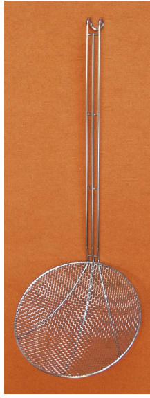
Araignée ronde renforcée Ø 260