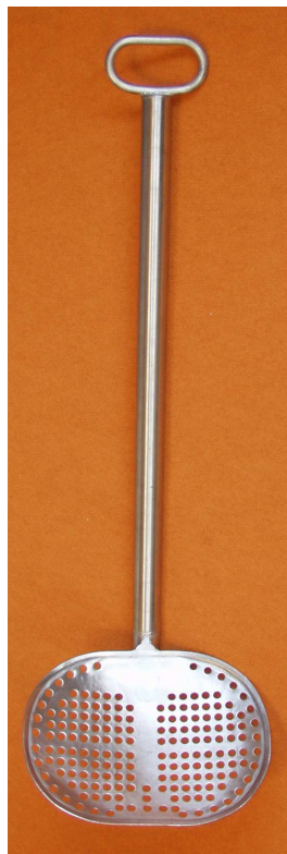
Pelle ajourée aluminium 420 x 280 manche PEHD